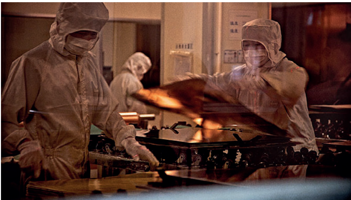
NCAB stiller høje krav til renhed, f.eks. som her ved opbygningen af "multilayer" pcb forud for presningen.