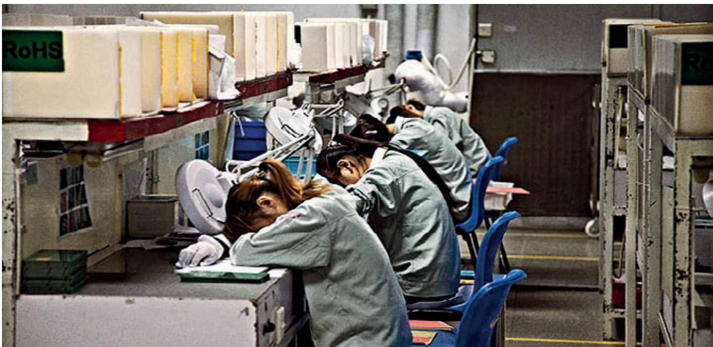
For at sikre fuld koncentration blandt de medarbejdere, der kontrollerer printkortene, holdes der pauser med jævne mellemrum.

Med printkort fra NCAB Group får du kvalitet, der virkelig kan betale sig med tiden. Det sker i kraft af en kravspecifikation, der er unik i branchen, og som omfatter ganske særlige kriterier og omfattende kvalitetskontrol. Kombineret med en meget stor købekraft sikres det herigennem, at fabrikkerne er indstillet på at tilpasse sig NCAB Groups krav.