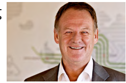
HANS STÄHL PDG DE NCAB GROUP

Les prototypes constituent de loin l'un des outils les plus importants pour permettre à un fabricant de réduire les délais de mise sur le marché de leurs produits et de limiter les coûts totaux de fabrication. Comme les PCB sont présents dans la plupart des produits technologiques actuels, les prototypes sont essentiels pour obtenir un produit final fonctionnant correctement. Il est donc grand temps que nous cessions de nous concentrer sur les délais de fabrication pour mettre l'accent sur la qualité et la productivité.