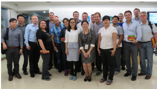
Hvert år inviterer NCAB Group en række kunder til at deltage i en kompetenceudviklende rejse til Kina.

"Disse rejser er en rigtig god måde at vise folk, hvordan de lokale NCAB-medarbejdere håndterer fabriksledelse samt hvordan og hvorfor vi vælger at samarbejde med bestemte fabrikker. Det giver kunderne en god mulighed for at opbygge deres kompetence, og på denne måde bliver de bedre i stand til at vurdere deres egne og kundernes produkter."