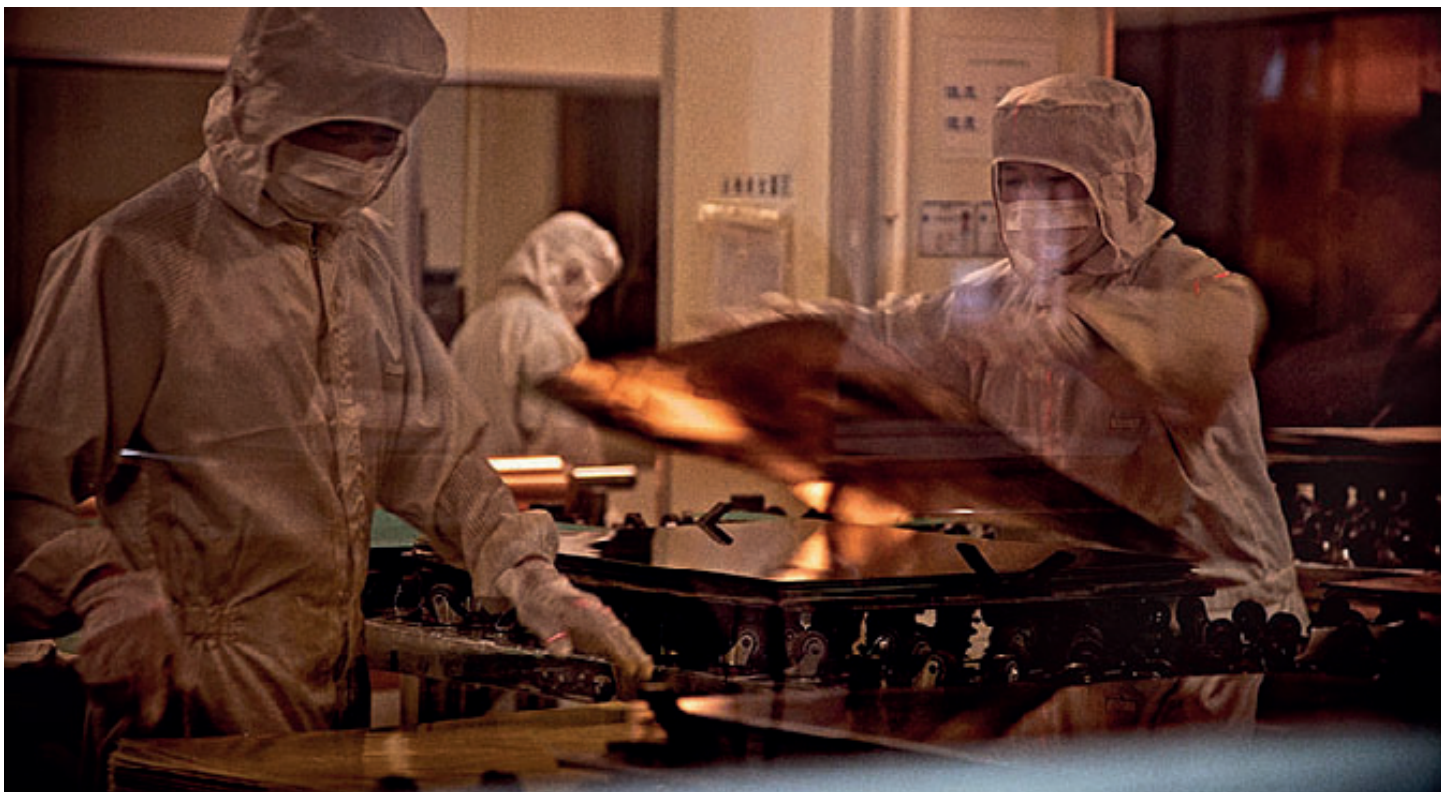
NCAB Group asettaa tiukat puhtausvaatimukset, kuten tässä prässäystä edeltävässä piirilevykerrosten valmistuksessa.