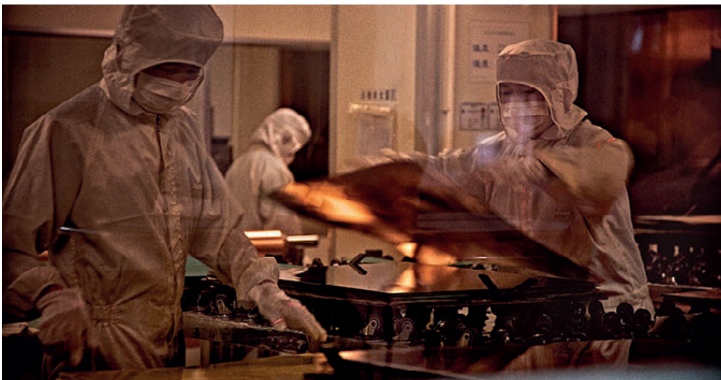
El grupo NCAB Group impone duras exigencias de limpieza, como aquí, por ejemplo, en la fabricación de circuitos multicapa antes del prensado.

supera con condiciones más exigentes en una larga serie de campos.