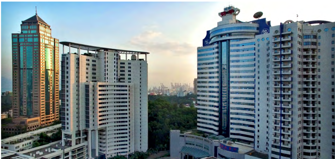
Cirka 60 % af printkortproduktionen i Kina finder sted i det sydlige Kina i Shenzhen. Det er også her, NCAB Group China har sit hovedkontor (til højre i billedet).