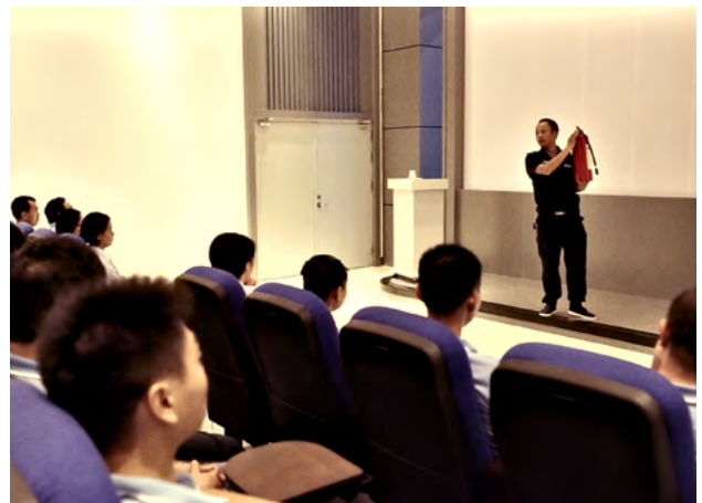
Att fabriksanställda fått lära sig hur skyddsutrustning ska användas och hanteras, och att detta finns dokumenterat, är en av de saker som kontrolleras i en hållbarhetsaudit.

– Jag genomför intervjuer med arbetare för att kontrollera verklig status på hållbarhetsarbetet. Har de lärt sig hur skyddsutrustningen används på rätt sätt? Underhålls utrustningen rätt? Hanteras kemikalier som de ska? Vilka försäkringar får de från fabriken? Känner de till lagar om minimilön, arbetstider och så vidare? Jag intervjuar också högsta ledningen om deras strategier, policys, organisation, målsättningar, aktiviteter och så vidare.