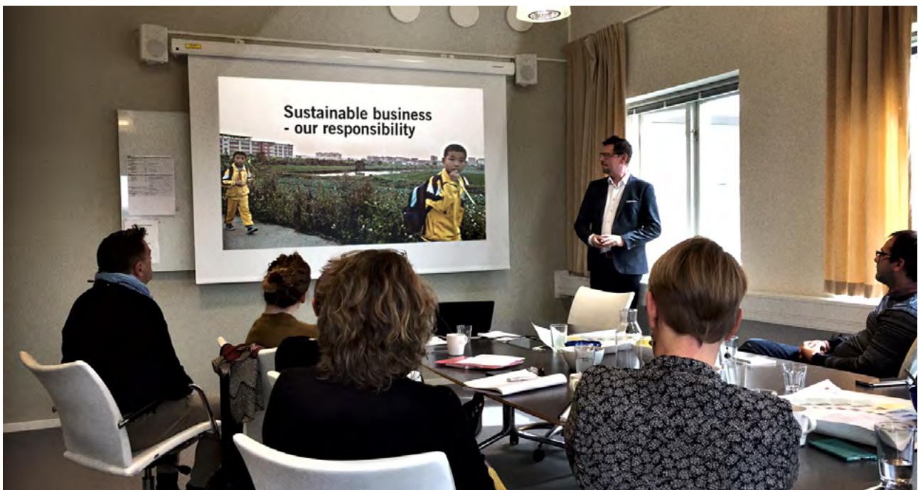
Under NCAB Groups globala introduktion av nyanställda får deltagarna bland annat höra om NCAB:s hållbarhetsarbete, värderingar och affäretik. Introduktionen fokuserar även på team building och är ett bra sätt att lära känna medarbetare i hela organisationen. Introduktionen genomförs på huvudkontoret i Sverige.

– Hållbarhet är med från start som en integrerad del av vår utvärde-