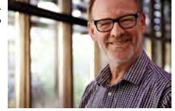
HANS STÄHL CEO NCAB GROUP

Laatu on tärkein piirilevyjä koskeva kriteeri. Vaikka piirilevyn osuus on vain noin 0,5–1 prosenttia lopputuotteen kustannuksista, sen vikaantuminen voi aiheuttaa tähtitieteellisiä kuluja, jos tuotteesta on tehtävä takaisinkutsu.